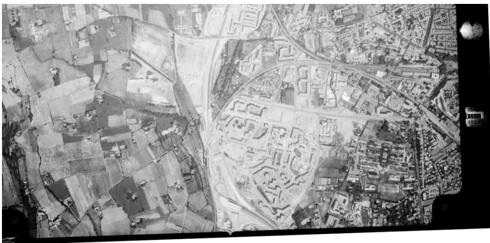
Le quartier d'Encagnane le 25 juin 1970

Le site d'étude du futur projet 17/18 de l'AUD'E devra sans doute dépasser la parcelle proprement dite ; il pourra être adapté en fonction des diagnostics et du programme envisagé en phase projet.