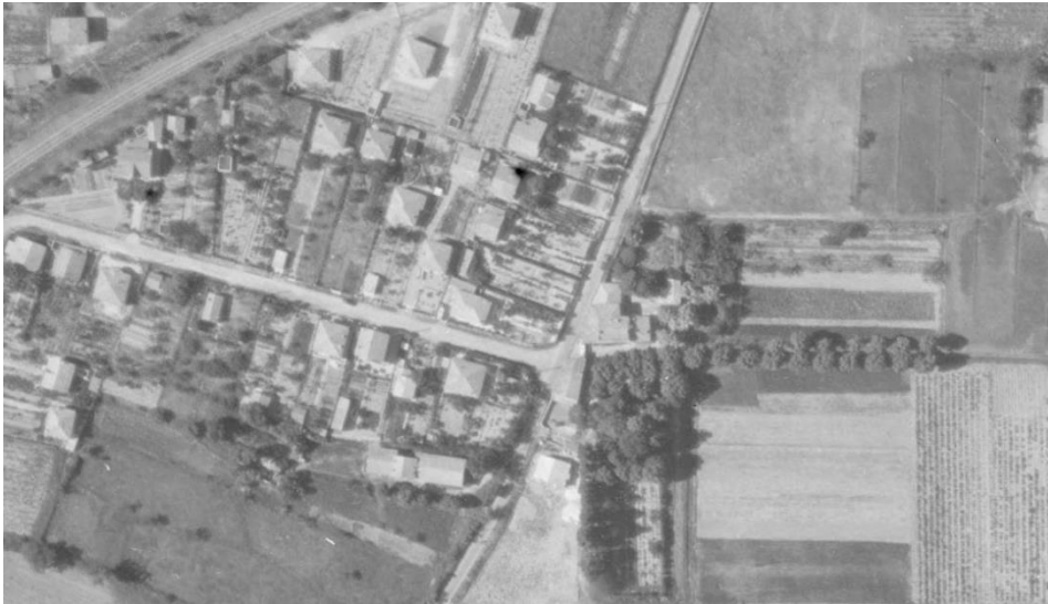
Le site et les bâtiments de La Mareschale en 1955