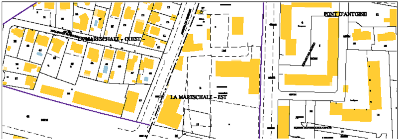
Extrait cadastral