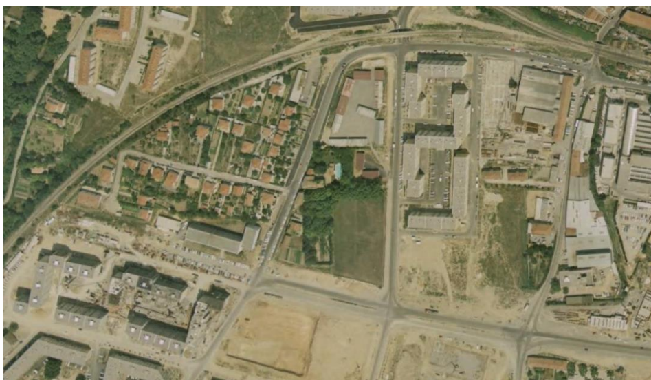
Le site et les bâtiments de La Mareschale en 1970 avec le quartier d'Encagnane en construction

Le site d'étude du futur projet 17/18 de l'AUD'E devra sans doute dépasser la parcelle proprement dite ; il pourra être adapté en fonction des diagnostics et du programme envisagé en phase projet.