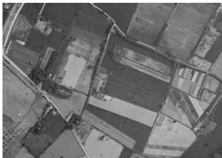
Le site et les bâtiments de La Mareschale en 1934