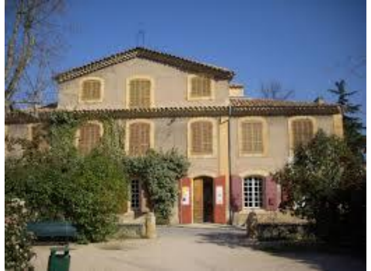
Façade Ouest sur rue de la maison de quartier La Mareschale Façade Sud sur jardin